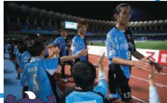
ハイタッチキッズ