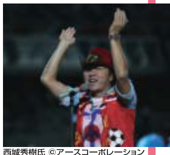
西城秀樹氏