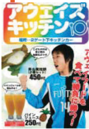
アウェイズキッチン