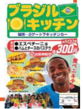
ブラジルキッチン