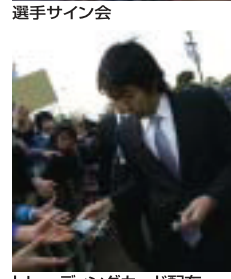
選手サイン会 トレーディングカード配布