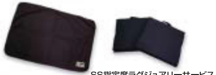
SS指定席ラグジュアリーサービス