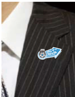
『うれし〜ピンバッジ』(イメージ)

さらに、『うれし〜フラッグ』も作成。選手入場時、フェアプレーフラッグと同様に選手を先導してフィールドに現れます。