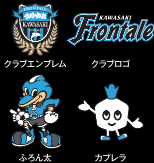
クラブエンブレム クラブロゴ ふるん太 カブレラ

スポンサー企業様で作成する広報印刷物等にご使用いただけます。 ※販売商品などへの使用はできません。 ※公序良俗に反する使用はできません。